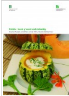
Landwirtschaftskammer Niederösterreich: Kürbis - bunt, g'sund und vielseitig