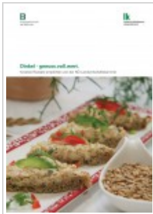
Landwirtschaftskammer Niederösterreich: Dinkel- genuss.voll.wert